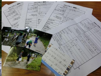
(槻川(埼玉県)では、毎月児童館の子どもたちが活動)