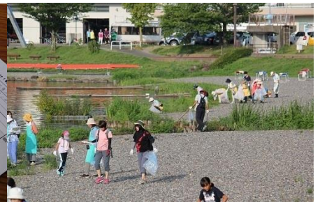
(下諏訪町では、町長も参加)