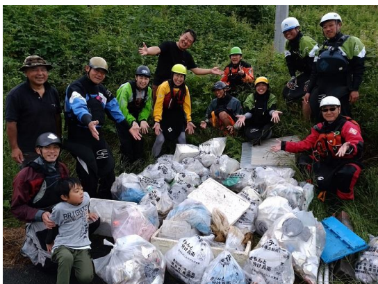
(最上川では、53 地点で調査実施)

美し山形・最上川フォーラム、自然環境見守り隊、下諏訪町諏訪湖浄化推進連絡協議会、小川町児童館エコクラブ、鋸南町雇用創造協議会、隅田川流域クリーンキャンペーン実行委員会、荒川クリーンエイド・フォーラム、ふるさと清掃運動会実行委員会、みずとみどり研究会、刈谷市民会議、虹のとびら BLUE WALK グループ、びわこ豊穰の里、海ごみ探偵団、保津川の魅力でまち興しネットワーク、恩地川クリーンリバープロジェクト、日本武道玉谷道場スポーツ少年団、その他