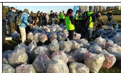
写真3 荒川での清掃活動(11/27)