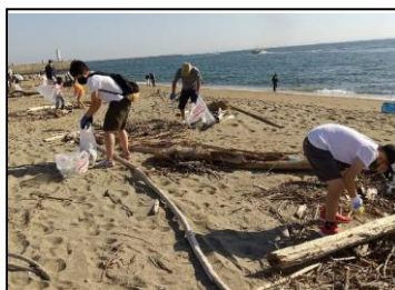
写真2 吉崎海岸での清掃活動(10/3)