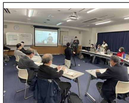
写真4 第7回川ごみサミット