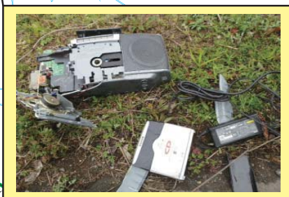
犬鳴川 4K600 右岸 ラジカセが投棄されている。