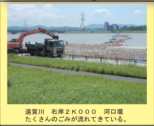
遠賀川 右岸 2K000 河口堰 たくさんのごみの流れ込んでいる。

平成30年度の遠賀川河川事務所管内の 不法投棄箇所 は、全体で 1,140地点 でした。 そのうち大型の不法投棄としては、バイクが5台、放置車両1台、冷蔵庫3台、テレビ11台、洗濯機1台となっています。 また、遠賀川河口堰に流れ着いたゴミは約965m 3 で、その処分費用に約 1,160万円 が費やされています。 きれいな遠賀川にするために、不法投棄防止にご協力下さい。