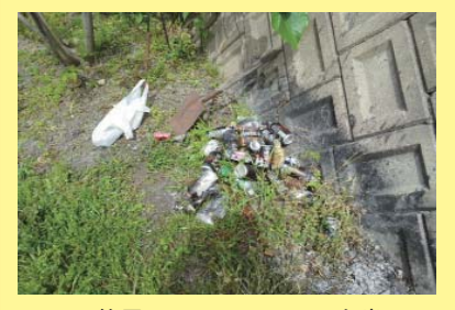
笹尾川 4K600 右岸 焼却および空き缶の投棄。