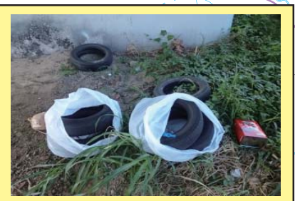
中元寺川 0K600 右岸 タイヤやオイル缶が投棄されている