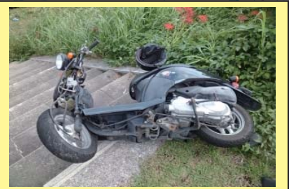
遠賀川 32K800 左岸 バイクが投棄されている。