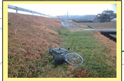
彦山川 23K000 左岸 自転車が投棄されている。