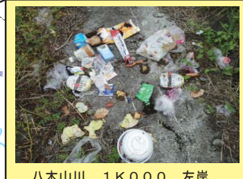
八木山川 1K000 左岸 家庭ゴミが投棄されている。