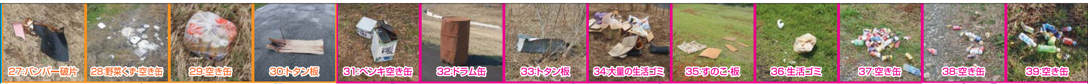
27:ハンバー破片 28:野菜くず空き缶 29:空き缶 30:トタン板 31:ペンキ空き缶 32:ドラム缶 33:トタン板 34:大量の生活ゴミ 35:すのこ板 36:生活ゴミ 37:空き缶 38:空き缶 39:空き缶