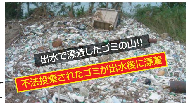
出水で漂着したゴミの山!!