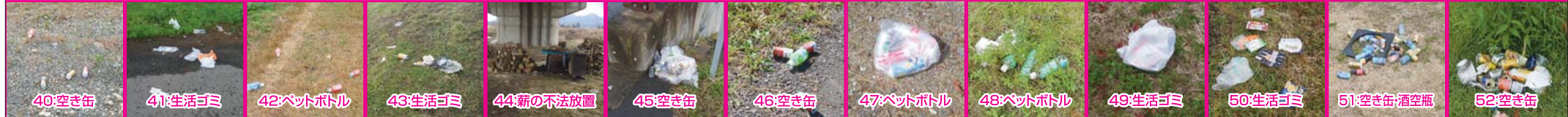
40:空き缶 41:生活ゴミ 42:ペットボトル 43:生活ゴミ 44:薪の不法放置 45:空き缶 46:空き缶 47:ペットボトル 48:ペットボトル 49:生活ゴミ 50:生活ゴミ 51:空き缶;酒空瓶 52:空き缶