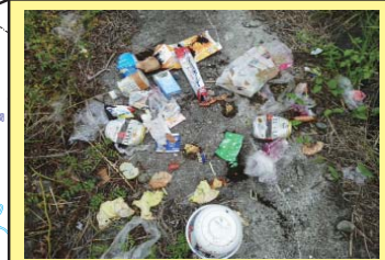
八木山川 1K000 左岸 家庭ゴミが投棄されている。