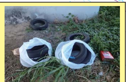
中元寺川 0K600 右岸 タイヤやオイル缶が投棄されている