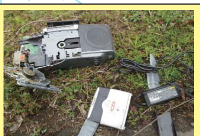
犬鳴川 4K600 右岸 ラジカセが投棄されている。