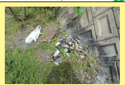
笹尾川 4K600 右岸 焼却および空き缶の投棄。