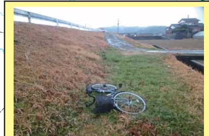
彦山川 23K000 左岸 自転車が投棄されている。