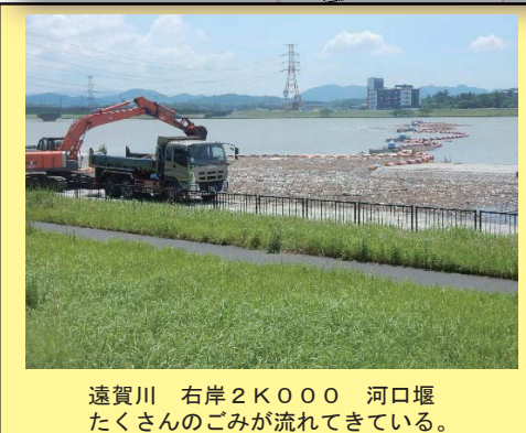
遠賀川 右岸 2K000 河口堰 たくさんのごみが流れてきている。

平成30年度の遠賀川河川事務所管内の 不法投棄箇所 は、全体で 1,140地点 でした。 そのうち大型の不法投棄としては、バイクが5台、放置車両1台、冷蔵庫3台、テレビ11台、洗濯機1台となっています。 また、遠賀川河口堰に流れ着いたゴミは約965m 3 で、その処分費用に約 1,160万円 が費やされています。 きれいな遠賀川にするために、不法投棄防止にご協力下さい。