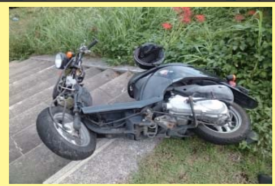
遠賀川 32K800 左岸 バイクが投棄されている。