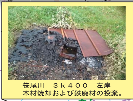
笹尾川 3k400 左岸 木材焼却および鉄廃材の投棄。